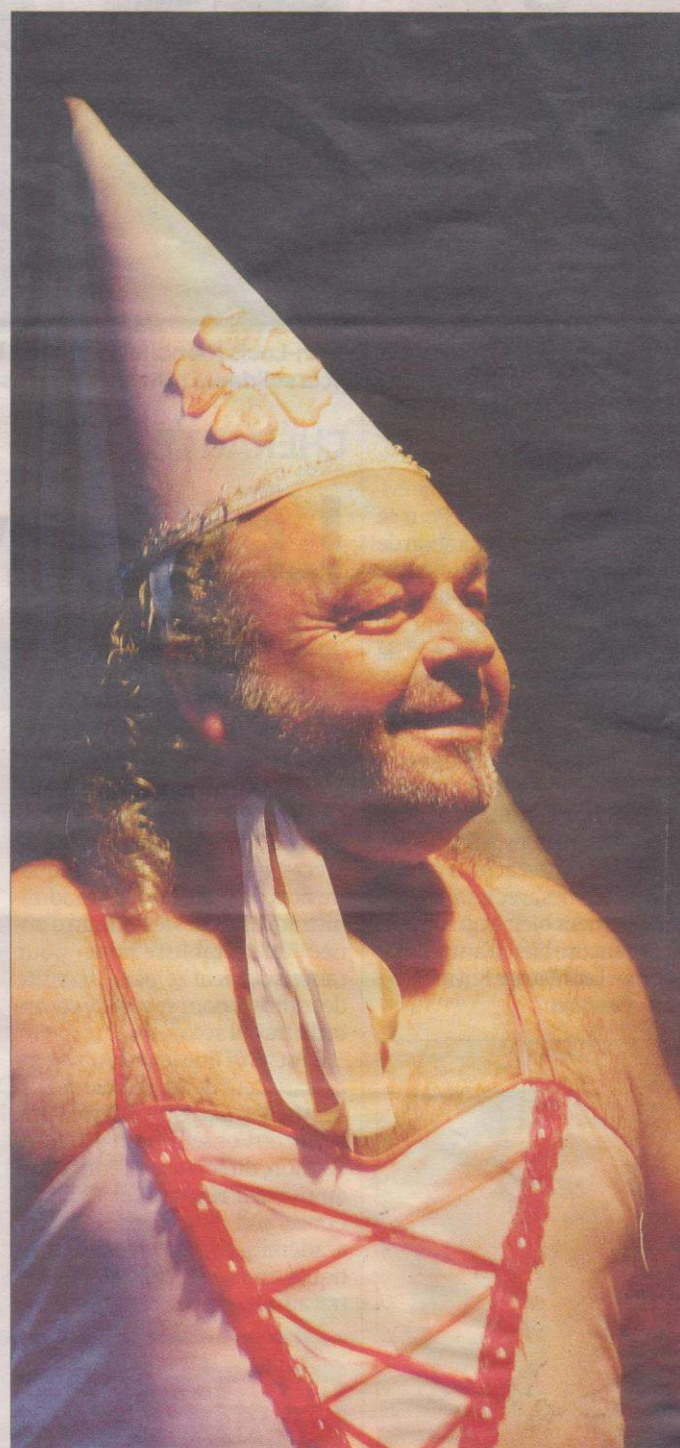
L'imaginaire, le cocasse et le délire. L'improbable Monsieur Fée de « La Belle aux encombrants ».

Mardi 5 février à 20 h 30, théâtre Francis-Planté, place Saint-Pierre. Tous publics. Tarifs : 11 €, abonnés à la saison culturelle et groupes 8 €, réduit (jeunes de 7 à 18 ans, et demandeurs d'emploi) 8 €.