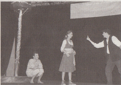
La Mondina au centre dab lo hilh e l'òmi(LS)

Quin tièner mei d'ua òra lo public dab un argument qui a prumèra vista e sembla tan tèune ? Dab pauc de causa d'Astròs qu'amuisha quin l'art de la rima e pòt dar espessor aus personatges e a l'istòria. Aus comedians en seguida de dar lo ritme e l'arsec necessari.